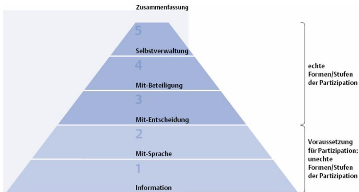
Abbildung 1: Fünf-Stufen-Modell der Partizipation nach FREHNER et al. 2007

Abbildung 1 stellt das Fünf-Stufen-Modell der Partizipation von Frehner et al. (2007a) vor.