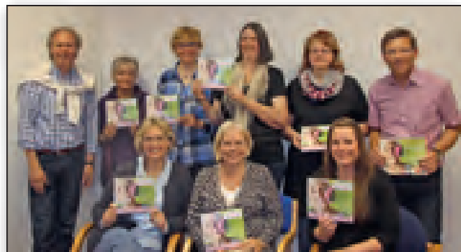
Ein Teil des Projektteams

Wir wollen bestehende Angebote aufzeigen und gemeinsam mit allen Beteiligten neue Projekte auf den Weg bringen.