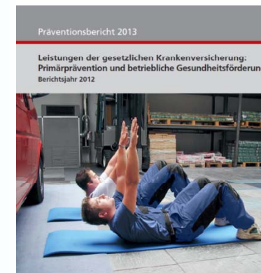
In Zusammenarbeit mit den Verbänden der Krankenkassen auf Bundesebene AOK-Bundesverband, Berlin BKK-Bundesverband, Essen BfA e. V., Berlin Bundesvereinigung für Landwirtschaft, Forsten und Gartenbau, Kassel Knappschaft, Bochum Verband der Ersatzkassen e. V. (vdek), Berlin