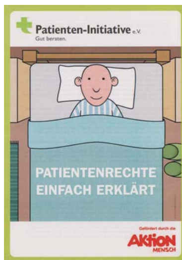
Auch in der neuen Broschüre ist Barrierefreiheit ein Thema

Arztwahl ist faktisch für Menschen mit Behinderung allein durch bauliche Barrieren eingeschränkt. Darum müssen zumindest die Informationen über barrierefreie Arztpraxen verfügbar und zutreffend sein. Die Bezeichnung „Barrierefreie Praxis“ muss zu einem Qualitätsmerkmal werden, ohne die kein Arzt und keine Ärztin auskommen will.