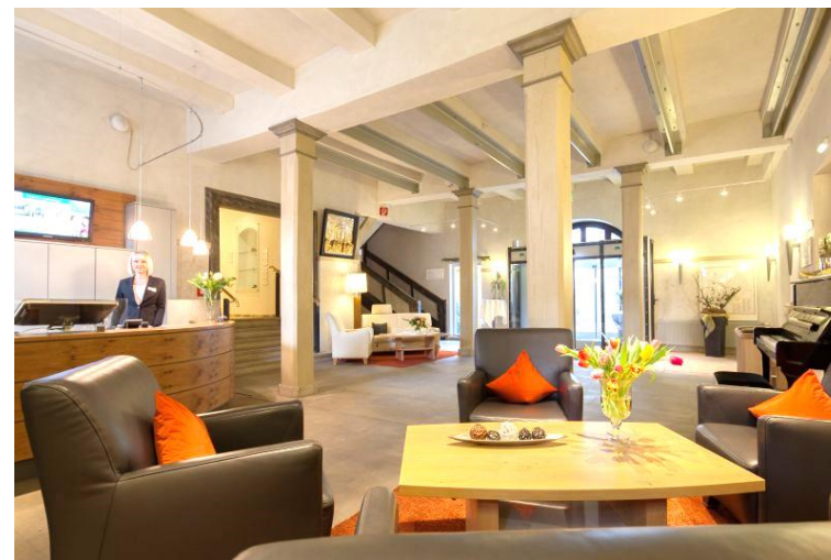
Blick in die Hotelloobby