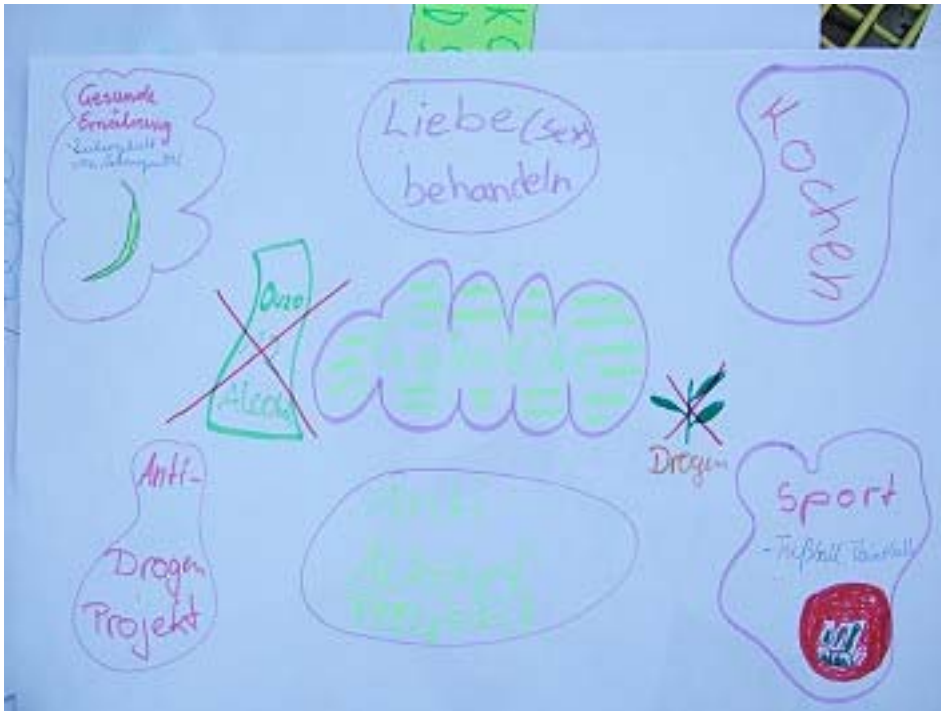
Abbildung 4: Kinderbild zum Projekt 2