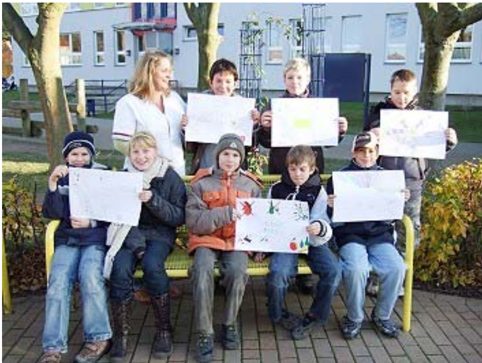
Abbildung 1: Gruppenfoto