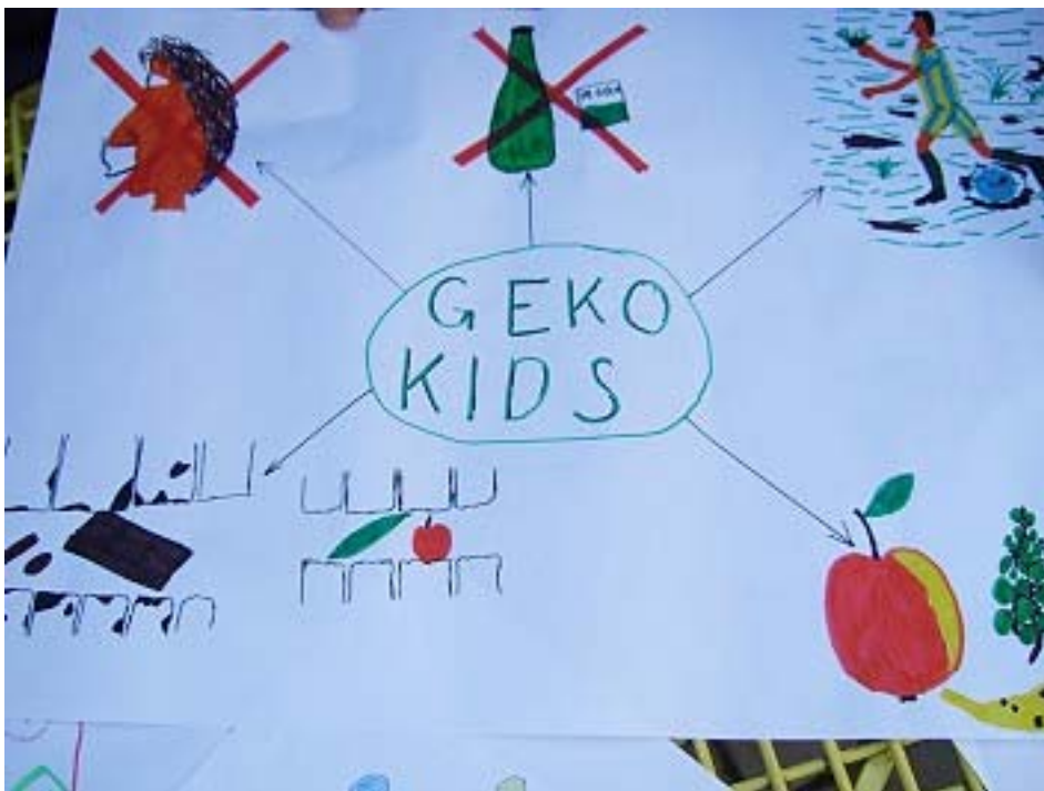
Abbildung 5: Kinderbild zum Projekt 3