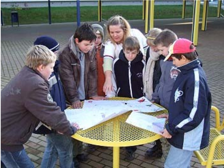
Abbildung 2: Kinder besprechen Ihre Bilder zum Projekt