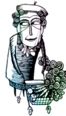
Hitliste der Sportformen / Altersgruppe 64 Jahre und älter

Als Motiv für Sportaktivität werden in erster Linie Gesundheit und Fitness (84,6%), das Zusammensein mit Anderen (22,5%) und das Naturerleben (18,9%) genannt. Gründe für Sportpassivität sind bei fast der Hälfte der Nicht-Sportler krankheitsbedingt (49,1%). Die Hitliste der Sportformen (s. Abb.) der Senior/innen sind Aerobic und Gymnastik (15,9%), dicht gefolgt von Radfahren (15,1%) und Schwimmen (11,6%). Bei den männlichen Befragten liegt der Radsport mit 16,9% weit vorn. Bei den weiblichen Befragten stehen Aerobic und Gymnastik mit 24,1% an erster Stelle.