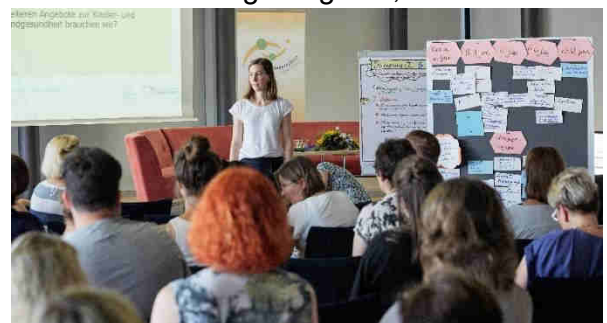
Abbildung 1: Einblick in das Dialogforum I

Im Rahmen der regionalen Partnerkonferenz fand ein Markt der Möglichkeiten statt, auf dem sich zahlreiche Angebote der Gesundheitsförderung und Prävention bei Kindern und Jugendlichen aus dem Landkreis Teltow-Fläming vorgestellt haben. Im Dialogforum I wurde diese Übersicht um weitere vorhandene Angebote, Strukturen und Träger ergänzt, die neben der medizinischen und therapeutischen Versorgung (z. B. Fachärztinnen und -ärzte der Gynäkologie und Pädiatrie, ambulante Psychotherapeutinnen und -therapeuten, Ergotherapie, Logopädie, Physiotherapie) im Landkreis vorhanden sind. Tabelle 1 fasst die Ergebnisse zusammen.