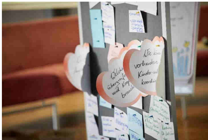
Abbildung 2: Eindrücke aus dem Dialogforum I